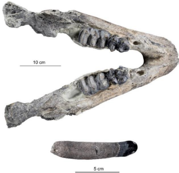
Unterkieferknochen mit Milchzähnen (oben) und Milchhauer, dem unteren Stoßzahn, (unten) des jungen Deinotherium levius aus der Hammerschmiede.