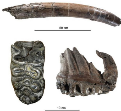
Oberer Stoßzahn (oben) und oberer dritter Backenzahn des Gomphotheren Tetralophodon longirostris aus der Hammerschmiede.